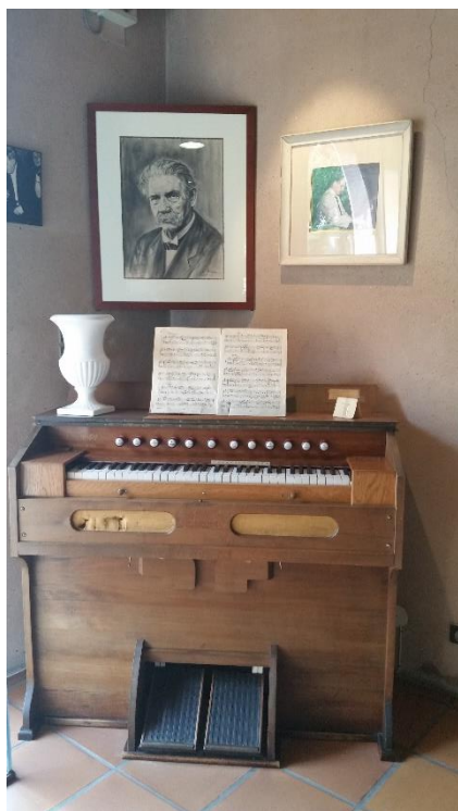
Tropenorgel van Albert Schweitzer

Pianosolo: Concerto III in D minor 2 e deel Alessandro Marcello arrangement door J.S. Bach